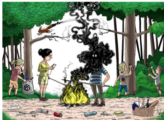
Cartoon: Silvan Wegmann