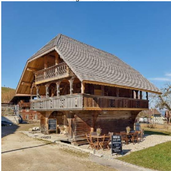
Landiswil, Dorf 65a - Speicher von 1765

Denkmalpflege Kanton Bern Bericht im Magazin Fachwerk 2022